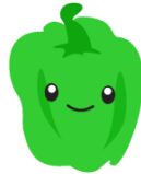
Green Bell Pepper