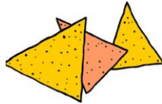
Whole Grain Tortilla Chips

4. What was your favorite part of today's lesson? (Circle)