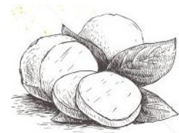
Bolitas de Queso Mozzarella

4. Cual fue tu parte favorita de la leccion de hoy? (Circula)