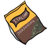
Aderezo Italiano en Polvo