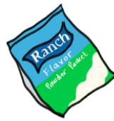
Polvo Sabor Ranch