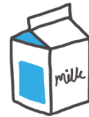
Leche sin Grasa

4. Cual fue tu parte favorita de la lección de hoy? (Circula)